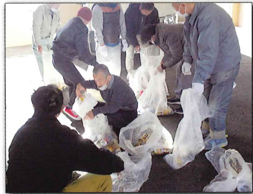
1/14イナほにゴミ整理「環境のために、小さなことから…」

お気軽にお問合せください。もちろん 作業作品（ガーゼはんかち・花台ふき オリジナルシュシュ・することメモ・猫 ちゃんの爪とぎ等）をご覧になりたい方 も大歓迎です。