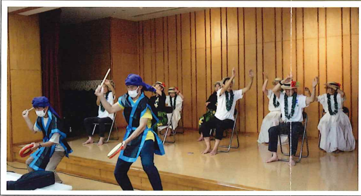
【フェアークラダンスと太鼓の競演 たおやかさと、力強さと】