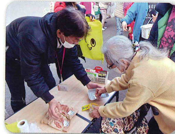
「いいお買い物できたわ」