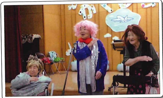
「うちら陽気ながしまし娘〜♪」