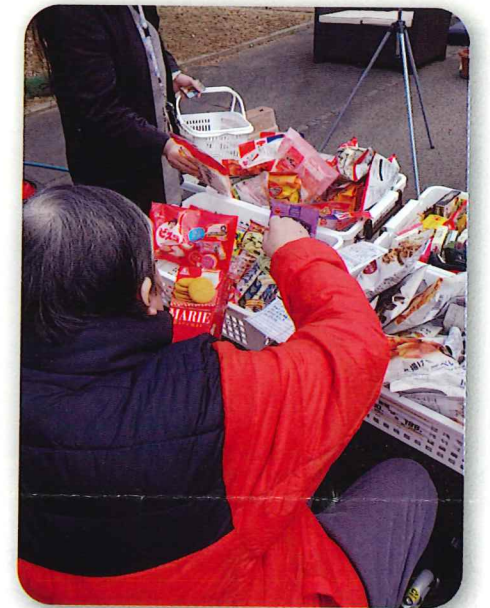
「なににしようかな?」