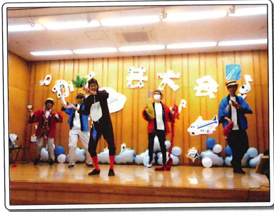
利用者で職員による出し物

かくし芸大会は、利用者さんが主役となり、普段は見ることのできない一面を披露する場です。出演者の皆さんは、この日のために練習を重ね、その成果を発揮されていました。歌唱や漫才、見ていて楽しめるパフォーマンスで盛りだくさんでした。大会終了後、利用者さんに感想を伺うと、多くの方から喜びの声が聞かれました。 □ 男性利用者さんからの感想「とても楽しかった！賞が取れてうれしかったです！」 □ 女性利用者さんからの感想「いろいろなバリエーションがあって、観ていてとても楽しかった！」 たくさんの笑顔と達成感に満ちた素晴らしい大会となりました。