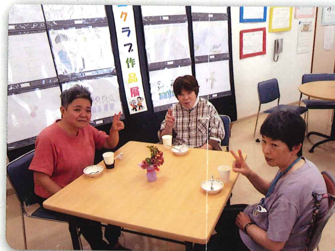
「チーズケーキおいしかった!」