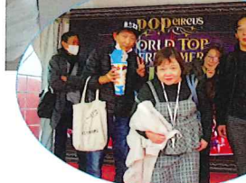
「サーカスの楽しみ」