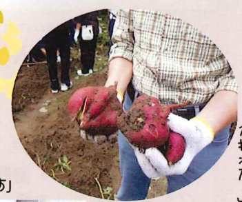
「丸々したサワウソモが採れた!」