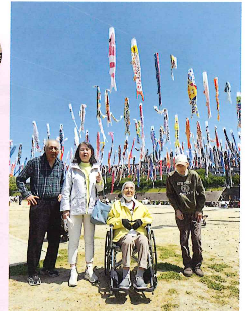
「今年も豊のぼいたくさん!」