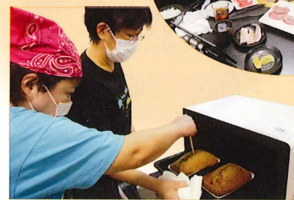
「みんなてクッキング」