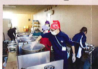
「非常時の炊き出し訓練も 行っています」