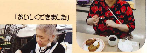
「おいしくできました」