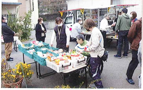
「移動販売、重宝してまあ」