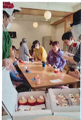
「クリスマスケーキで盛りだくさんかお楽しみ」

このところすごい勢いでインターネットの世界が広がっており、私たちの生活に欠かせないインフラとなつていきました。一方でインターネットの利用には費用がかかりますので、お金のあるなしで情報格差が広がることや、社会参加が限られてしまうことが進んでいくことにもなります。そこで、高槻温心寮ではより多くの人たちがインターネットを使い、生活を豊かにする手段を得てもらえないかと考え、今春から地域交流スペースでフリーWi-Fiを設置することにしました。 現在のところ、皆さんには好評で、家族や友人との連絡が容易になったことや、ニュースや地域情報に接する機会が増えたこと、SNSなどを通じて社会とのつながりが増えたよとの声をいただいています。 また、高槻温心寮では施設周辺にお住まいのすべての方にもフリーWi-Fiを設置した地域交流スペースを活用していただき、住みよい地域づくりをすすめるお手伝いをさせていただきたいと考えています。お近くにお住いの方はぜひご利用ください。