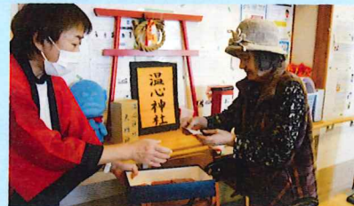
「今年の運勢はどうか？」